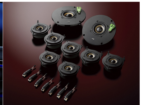
左:メルセデス・ベンツSクラスへの装着イメージ(画像は合成によるもので、スピーカーユニットは実際には見えません) 右:2C-222 Double Crestを構成するスピーカーモジュール