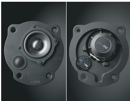
優れた制振・補強効果を発揮するアコースティックデッキ(写真はSP-639M)