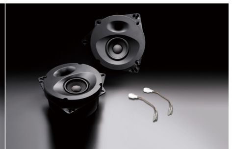
SP-861 (純正2スピーカー装着車専用)