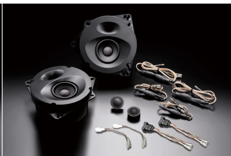
SP-862 (純正6スピーカー装着車・フロント専用)