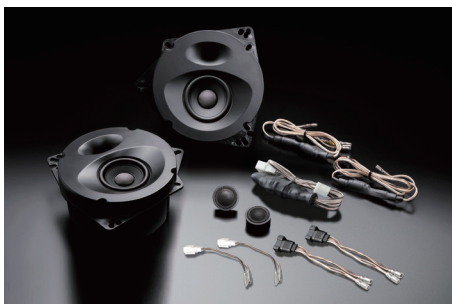
SP-868 (純正8スピーカー装着車・フロント専用)

【製品に関するご注意】 ●本製品は音質最優先設計のため、純正リアスピーカーと比較して能率(出力音圧レベル)がやや低めに設定されております。本製品を8スピーカー車または6スピーカー車に装着し、純正リアスピーカーと併用する場合は純正AVシステム側のフェーダーを使ってフロント/リアの音量バランスを再調整されることをお勧めします。 ●ソニックデザイン製品認定販売店では、SonicPLUSの高音質をさらに引き立てるグレードアッププランも各種用意しております。これらのプランはSonicPLUSを装着した後もご検討・ご注文いただくことができ、オーナーひとりひとりのご要望に沿った多彩なカスタマイズをお楽しみいただけます。詳しくはお近くのソニックデザイン製品認定販売店、または直接弊社へお問い合わせください。