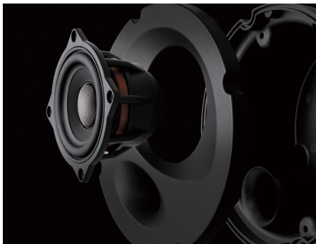
エンクロージャ一体型ウーファーマジュール